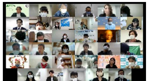
▲オンラインセミナー開催風景

このような情報共有や意見交換の機会は貴重で有意義なのでまた開催してほしいです。(障害)